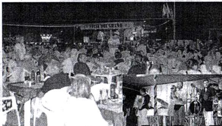
NELLA FOTO SOPRA UNA VEDUTA D'INSIEME DELL'AREA DEDICATA ALLA FESTA DEL GRANO PRESSO L'ORATORIO DI GUINZANO. A DESTRA UNA DELLE ORCHESTRE SI ESIBISCE SUL PALCO